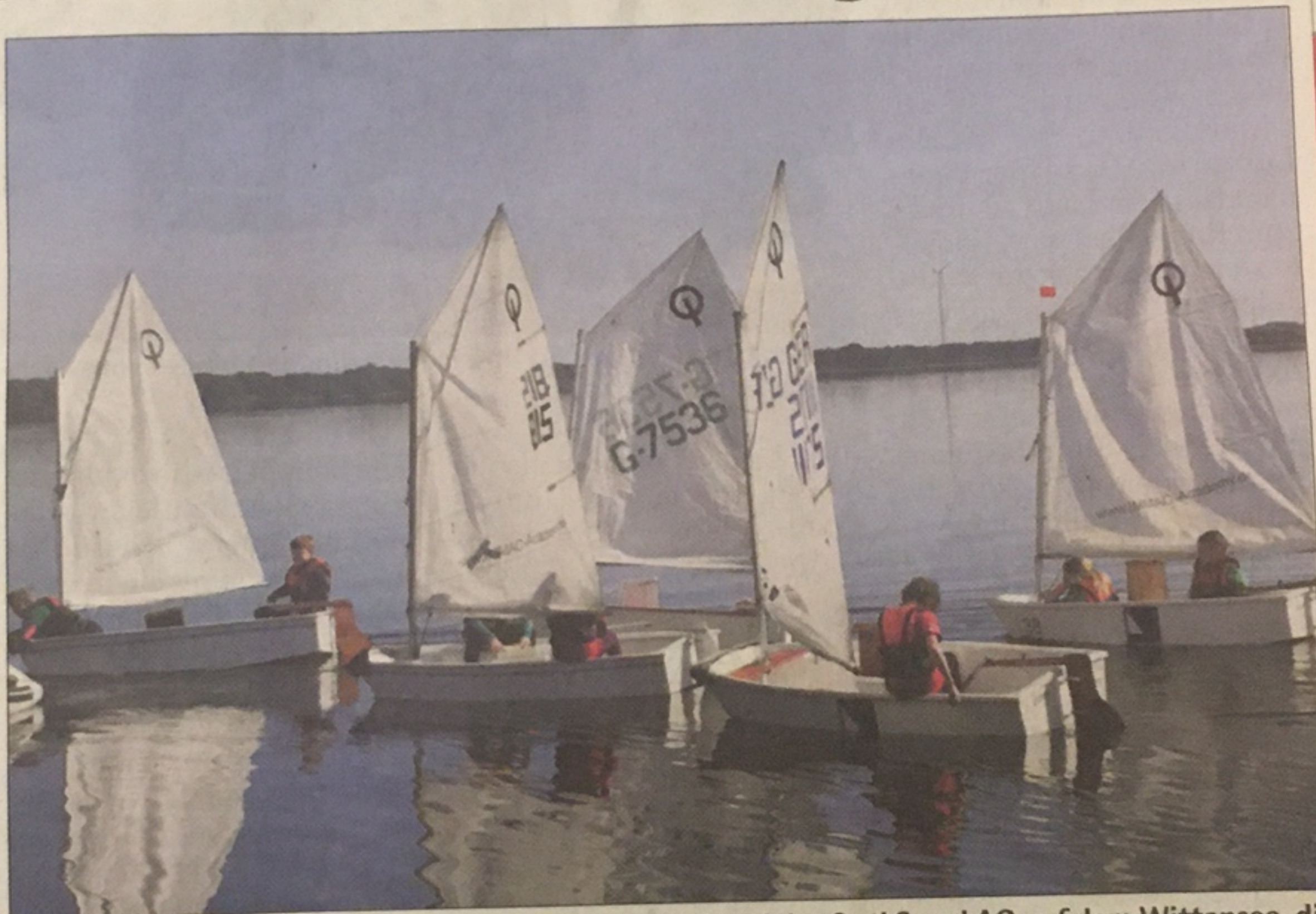
Schülerinnen und Schüler der Grundschule Borgstedt bei der Opti Segel AG auf dem Wittensee, die vom Wassersportclub am Wittensee im Rahmen des LSV-Projekts „Schule+Verein“ angeboten wird.

So auch an der Grundschule Borgstedt. Dort bietet der Wassersportclub am Wittensee (WSCW) eine Opti Segel-AG für Schülerinnen